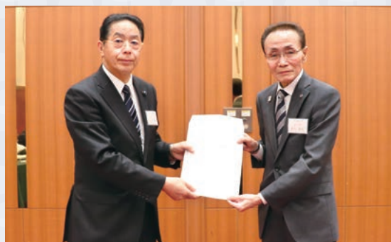
宅建議連 浜田会長（左）、貝川会長（右）